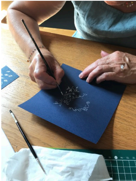
Dessin de dentelle