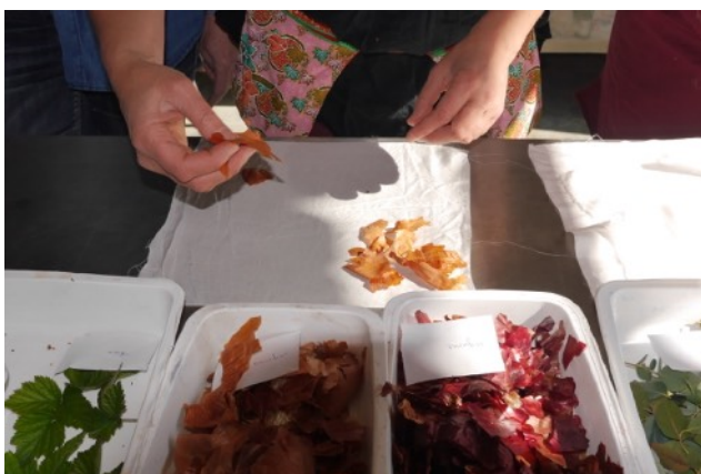
Atelier Eco-print, technique d'impression direct avec les plantes