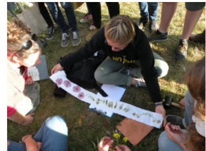
Découverte des plantes sauvages colorantes