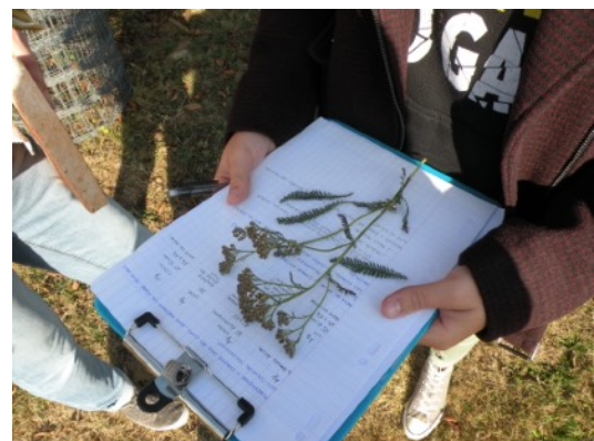
Découverte des plantes sauvages colorantes