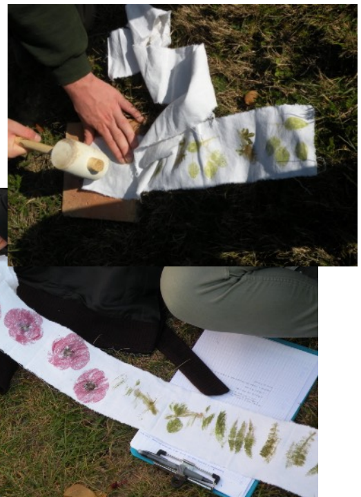
Atelier Tataki Zome