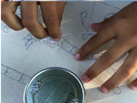
Broderie à l'aiguille