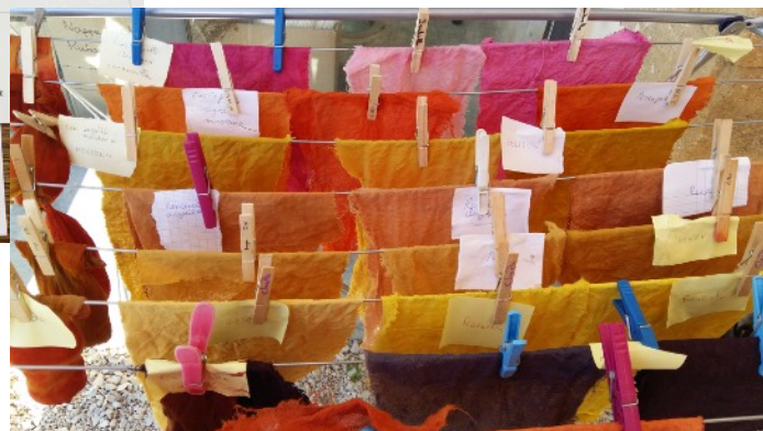
Nuancier de couleurs